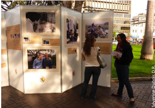
Séverine Dubois D.R.

« Nous avons pu présenter en plein centre de Lima l'exposition "Pauvres et Dignes", qui cherche à transmettre par des photos, des visages, l'expérience que nous vivons auprès des plus pauvres depuis déjà vingt ans. Transmettre notre regard