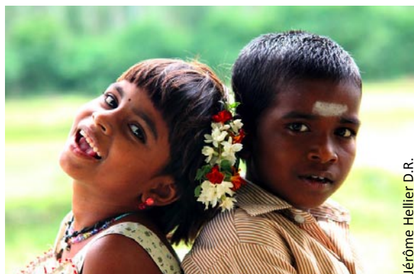
Jérôme Hellier D.R.

Ces derniers mois, l'éducation des enfants est devenue une priorité. Nous essayons de prendre du temps avec chacun d'eux afin de découvrir leurs talents personnels.